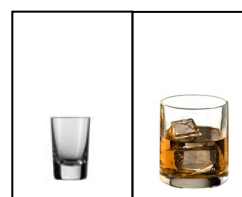
1 Glas Spirituosen ("doppelter Schnaps") = 0,04l