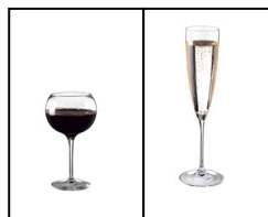
1 kleines Glas Wein oder Sekt = 0,1l