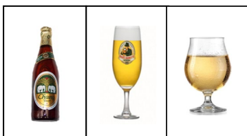
1 kleine Flasche oder 1 kl. Glas Bier oder Cider (Apfelwein) = 0,33l

Bitte beachte die jeweiligen Flaschen- und Gläsergrößen!