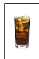
1 Glas alkoholhaltige Mixgetränke = 0,33l